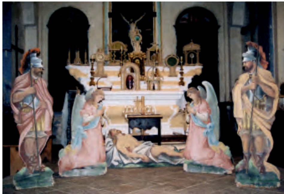
4. Sepolcro , silhouettes peintes, 1870-1880, San Martino di Lota (Haute-Corse), église paroissiale.