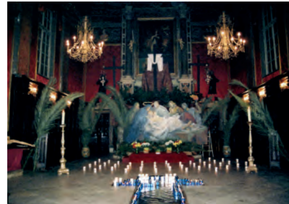
6. Albert Gillio, Sepolcro , «La mise au tombeau», 1957, Bastia (Haute-Corse), oratoire de la confrérie de l'Immaculée Conception.

ne mentionnent guère plus d'un ou deux reposoirs, jugés particulièrement remarquables. Les reposoirs de l'année 1902 furent exceptionnellement réussis, aussi un article du 28 mars en cite cinq nommément : « Nous avons constaté avec plaisir que les reposoirs étaient ornés avec beaucoup plus de soins et de goût que les années précédentes et qu'ils représentaient tous des scènes de la Passion: la Flagellation à Saint Roch ; la Libération de Barabbas et la condamnation de Jésus au Saint Nom de Marie ; le tombeau de