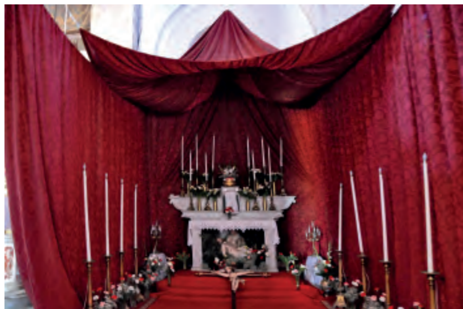
1. Sepolcro , pavillon textile en damas rouge (XX e s.), Erbalunga di Brando (Haute-Corse), église Saint Erasme.

sent la présence de sa représentation en manifestant sa royauté mystique. De nos jours, on peut en voir un exemplaire dans l'église Saint Erasme d'Erbalunga (sur le territoire de la commune de Brando). Il s'agit d'une grande tente en damas rouge, que l'on monte autour de l'un des autels latéraux de l'édifice. La table d'autel, creuse, abrite une Pietà de plâtre peint. Le reposoir, garni de fleurs et de cierges, est complété d'un tapis sur lequel on dépose un Crucifix en bois polychrome.