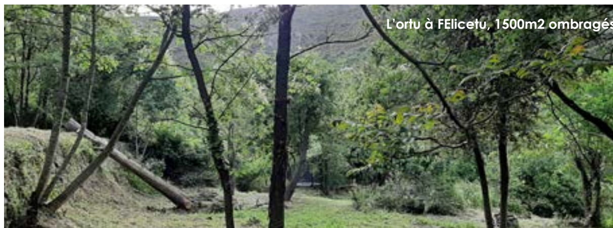
L'ortu à FELicetu, 1500m 2 ombragés

Enfin, nous vous demandons à chacun de respecter les consignes générales de sécurité sanitaire (ne pas venir en cas de fièvre, toux, signes d'infection rhinopharyngée, ...).